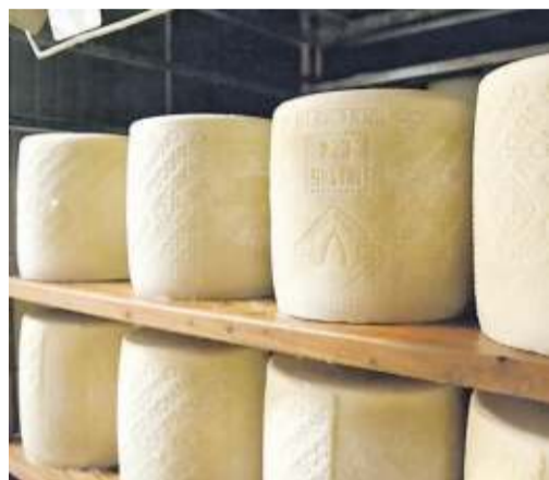
Forme di pecorino romano stoccate per la stagionatura. I formaggi ovini Dop hanno fatto segnare una ripresa

Fa da traino l'incremento delle vendite del Pecorino Romano e del Fiore Sardo. Il report della Cna: aumenta del 4% l'esportazione dei prodotti dell'agricoltura