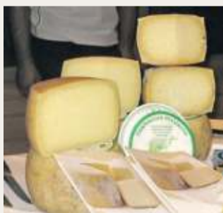
Pecorino in vetrina

IL REPORT DELLA CNA SULL'ECONOMIA DELL'ISOLA