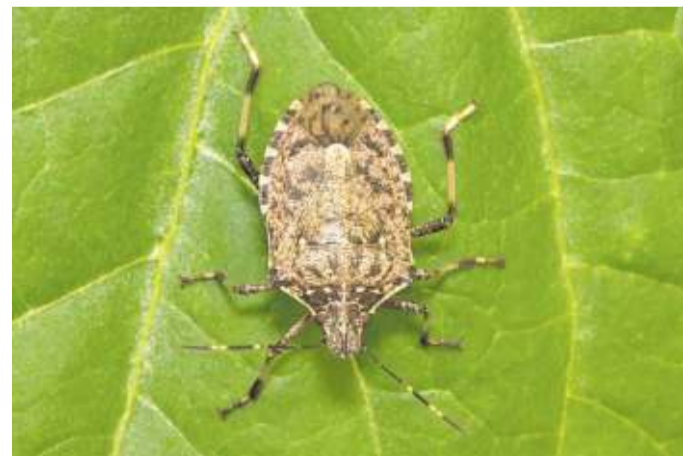
Un esemplare di cimice asiatica

fase che precede i primi ritrovamenti sui campi. «Significa che a partire dalla prossima primavera potremmo trovarci di fronte a una nuova invasione - spiega Luca Saba, direttore Coldiretti Sardegna - un'emergenza che in altre regioni d'Italia ha rappresentato l'ennesimo flagello per tantissime realtà produttive, tanto da essere considerata dal governo come emergenza fitosanitaria nazionale assieme alla Xylella». Un problema a cui prestare quindi molta attenzione, è difficile pianificare azioni di contrasto una volta che è già avvenuta la pullulazione, se non attraverso