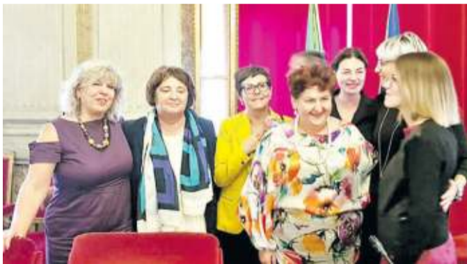
L'incontro di ieri a Roma con la ministra Bellanova